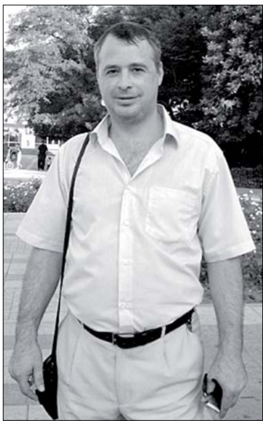
Гор Кавказских крепкий пояс Окружил его каймой.